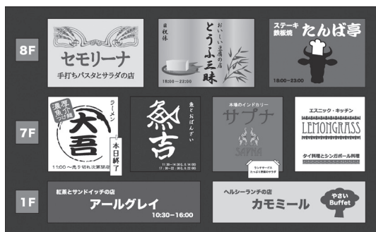
Signboards written in Japanese