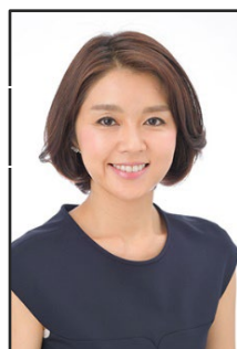
塚原愛アナウンサー