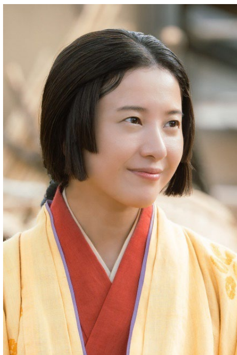
吉高由里子（まひろ／紫式部役）