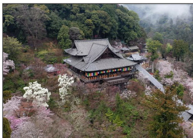
「長谷寺」 (奈良県桜井市)