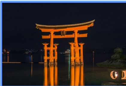
厳島神社 (広島 廿日市市)