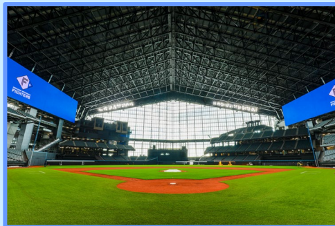
エスコンフィールド 北海道 (北海道 北広島市)