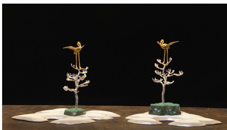
今回復元新調された神宝・金鶴洲浜台