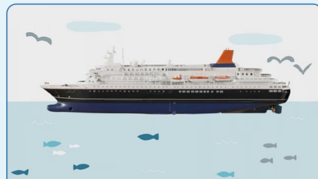
重いのに浮かんでいる船