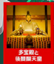
多宝殿と 後醍醐天皇