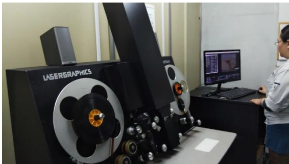
フィルムの4Kスキャン作業