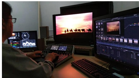
カラーグレーディング作業

1980年代はじめ、中国・長安(西安)からローマへいたる道のりを記録し、一大ブームを巻き起こした「NHK特集 シルクロード」。16ミリカラーフィルムで撮影された大型紀行番組が、4KHDRの鮮やかな映像でよみがえる。今回放送するのは、シリアを旅した第2部 第十五集「キャラバンは西へ～再現・古代隊商の旅～」(初回放送1984年6月4日)。いまは激しい内戦下にあるシリアの、当時の人々の暮らしや、破壊された世界遺産・パルミラ遺跡の在りし日の姿が描かれている。