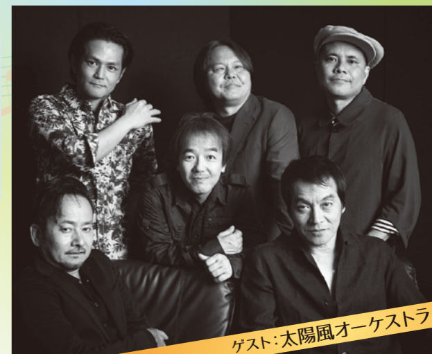
ゲスト:太陽風オーケストラ

今月のゲストは、太陽風オーケストラ!沖縄発・地球音楽をテーマに掲げ活動が続いているインストゥルメンタル・バンドです。今年30周年を迎えた彼らの足跡と音作りを振り返るとともに、沖縄音楽の新しい可能性を紐解いていきます。