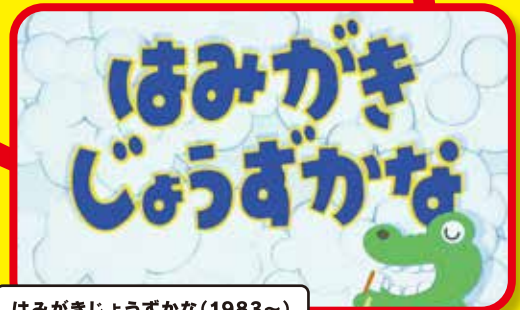
はみがきじょうずかな(1983～)