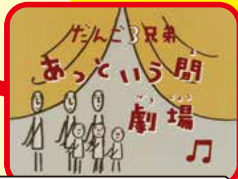
だんご3兄弟あつという間劇場(アニメ)