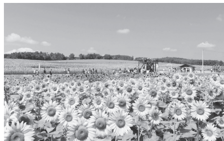
北龍町の向日葵(北海道)

每到夏天，一望無際的薰衣草和向日葵花田便會吸引大批遊客前來觀光。秋天是欣賞紅葉和大波斯菊的季節。梅花會從冬天綻放到春天。看到梅花，人們就知道「春天已經不遠了」。