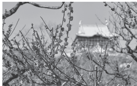
大阪城的梅花(大阪)