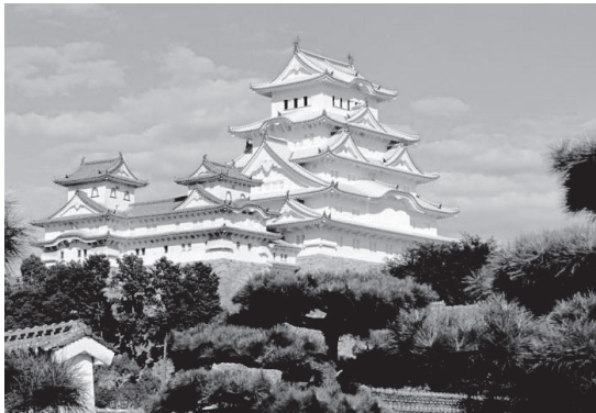
قلعه ی هیمة جی شهر هیمة جی ©