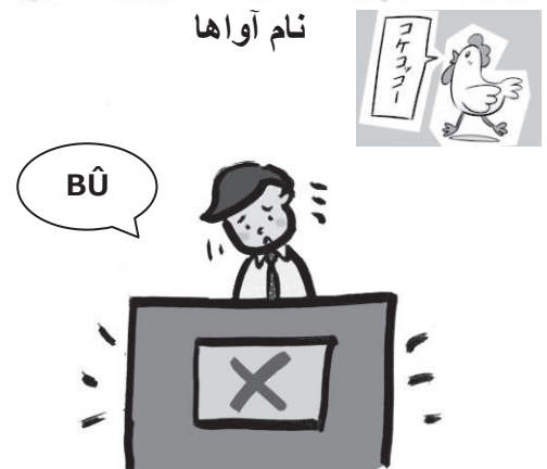
این واژه نشانه ی پاسخ نادرست است.