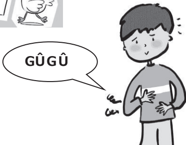
C'est le gargouillis d'un estomac vide.