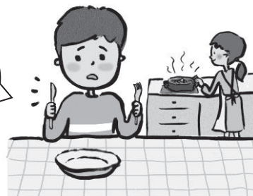
C'est le fait d'avoir très faim.