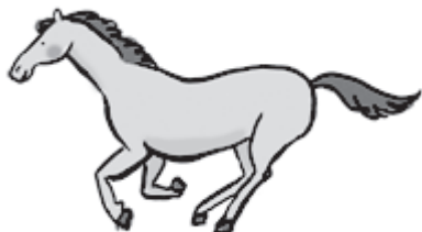
形容马奔跑的声音。