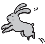
Menggambarkan kelinci melompat-lompat.