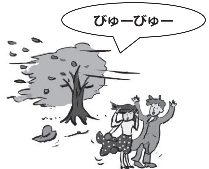
形容狂风大作的样子。