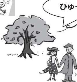
形容风刮个不停的样子。