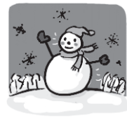
ふゆ 冬 (冬天)