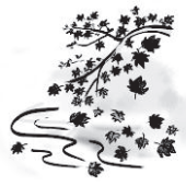
あき 秋 (秋天)