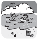
なつ 夏 (夏天)