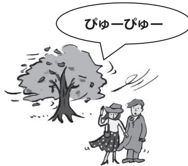
形容更大一点儿的的风。