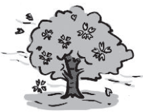
はる 春 (春天)