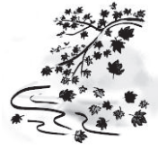
AKI (ฤดูใบไม้ร่วง)