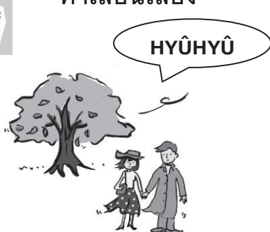
คำอธิบายเมื่อลมโชยมา