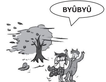
เมื่อลมกระโชกแรงขึ้นและเร็วขึ้น