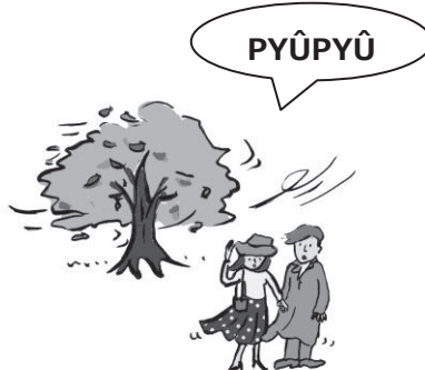
เมื่อลมแรง