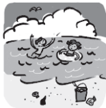
NATSU (Musim Panas)