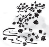
AKI (Musim Gugur)