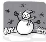
FUYU (Musim Dingin)