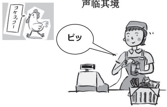
这是在收银台读取条形码的声音。