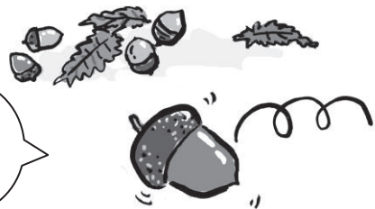
形容又小又轻的东西滚动的样子。