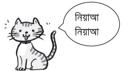
বিড়ালের মিউ মিউ ডাক।