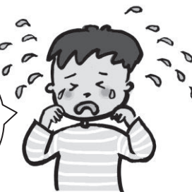
เด็กร้องไห้เสียงดัง