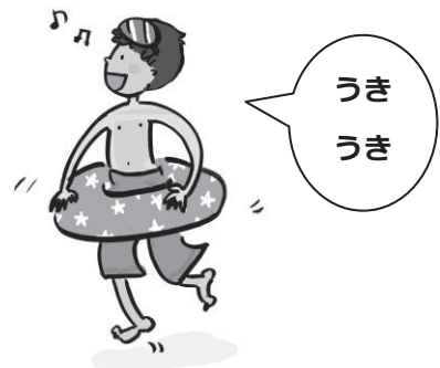
마음이 들떠 있는 모습