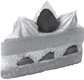
Japon çilekli pastası

Batı tarzı olarak bilinen birçok tatlı da Japonya'ya özgü çeşitlere sahiptir. Örneğin, çilekli pastalarda Batı tarzına göre daha yumuşak sünger kekler kullanılır. Meyveli parfelerin renkleri de göz alıcıdır.