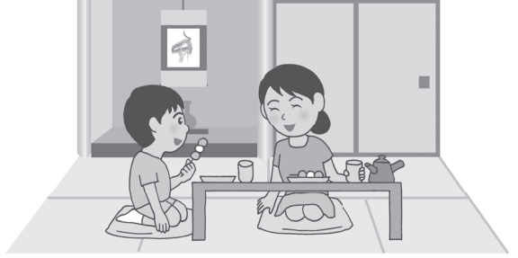
Japon tarzı oda

Batı tarzı odalarda ise yer döşemesi ahşap veya halıdandır ve genellikle masa ve sandalyeler bulunur. Günümüzde Batı tarzı odalar daha yaygın hale gelmiştir. Birçok evde iki tarz bir arada kullanılır.