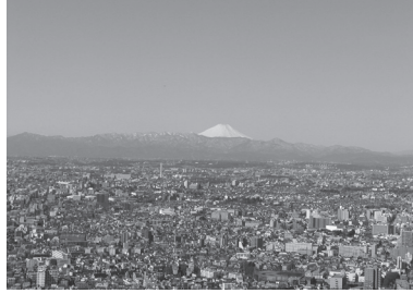
Gözlem yerinden manzara