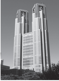
Tokyo Büyükşehir Belediye Binası

Diyaloğumuzun geçtiği Tokyo Büyükşehir Belediye Binası Shinjuku'dadır. Gözlem yeri halka açıktır. Burada 202 metre yükseklikten Tokyo'nun panoramik manzarasının tadını çıkarabilirsiniz.