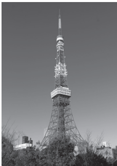
Tokyo Kulesi (333m)

Tokyo Kulesi de parlak turuncu ve beyaz renkleriyle ünlüdür. Asakusa yakınlarındaki Tokyo Skytree, 2012 yılında inşa edilmiş ve dünyanın en yüksek kulesi olmuştur. İki kule de gece ışıklandırma ile çok güzel görünür.