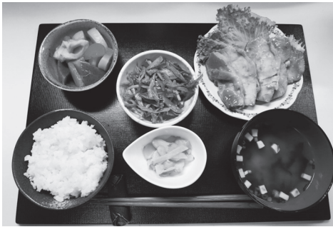
Sıradan bir öğün

Pirinç, Japonya'daki temel gıda maddesidir. Genelde, buharda haşlanmış pirinçle birlikte balık, et ve sebze yenir. Miso çorbası veya başka bir çeşit çorba da sıklıkla öğünlerde bulunur. Spagetti ve yahni gibi Batı yemekleri de her yerde bulunur.