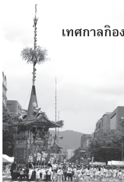
เทศกาลกiong (เกียวโต/กรกฎาคม)

ญี่ปุ่นมีเทศกาลตามประเพณีหลากหลายเทศกาลในพื้นที่ต่าง ๆ ทั่วประเทศ ว่ากันว่ามากถึงหลายหมื่นเทศกาล เช่น “เทศกาลกiong” ของเกียวโตขึ้นชื่อด้านความเก่าแก่ทางประเพณีเป็นพันปี ในเทศกาลนี้มีรถขนาดใหญ่ตกแต่งประดับประดาหรรษาวิจิตรพากันเคลื่อนเป็นขบวนแห่ไปตามถนน หรือเทศกาลอื่น ๆ ที่มีชื่อเสียง เช่น “เทศกาลอาโอโมริเนบูตะ” ในอาโอโมริ อันมีลักษณะเด่นที่การนำตุ๊กตาซึ่งขนาดใหญ่ขึ้นรถแล้วแห่ และ “เทศกาลอวาระโอดิริ” ในโทกุชิมะ ซึ่งมีผู้คนมากมายเข้าร่วมการร่ายรำอย่างคึกคัก