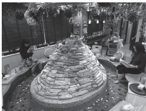
คาเฟ่หน้าร้อนแช่เท้า

มีคาเฟ่ที่น่าสนใจประเภทอื่น ๆ อีก เช่น คาเฟ่สาวใช้ คาเฟ่ท้องฟ้าจำลอง และคาเฟ่หน้าร้อนแช่เท้า