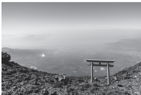
နေထွက်ချိန် တောင်ထိပ်က မြင်ကွင်း