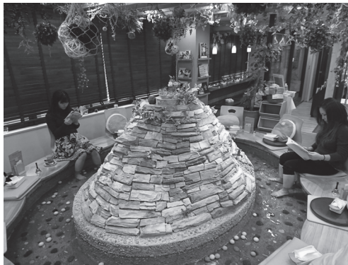
ခြေထောက်ရေစိမ်လို့ရတဲ့ ကဖေး

ဒွါအပြင် အနောက်တိုင်းက အိမ်အကူအမျိုးသမီးလို ဝတ်ဆင်ကြတဲ့ စားပွဲထိုးတွေက ဝန်ဆောင်မှုပေးတဲ့ မိတ်ဒိုကဖေး၊ နုကွတ်တာရာပြခန်းကဖေး၊ ခြေထောက်ရေစိမ်လို့ရတဲ့ ကဖေး စတဲ့ စိတ်ဝင်စားစရာ ကော်ဖီဆိုင်အမျိုးမျိုးရှိပါတယ်။