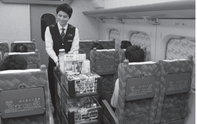
CENTRAL PASSENGERS