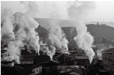
벳푸 온천 (오이타 현)