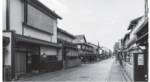
पुरानी शैली का मकान, माचिया

क्योतो पैदल घूमने के लिए बहुत अच्छी जगह है। वहाँ दोनों तरफ़ माचिया की कतारों वाली गलियों में या नदी किनारे आराम से टहलना बहुत अच्छा लगता है। जापानी मिठाई खाने के लिए पारम्परिक कैफ़े में जाने में भी मज़ा आता है।