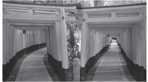
फुशिमि इनारि ताइशा श्राइन