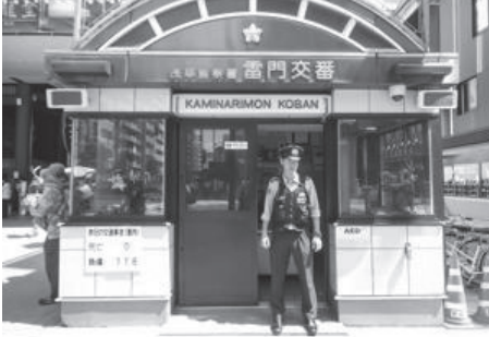
Metropolitan Police Department website