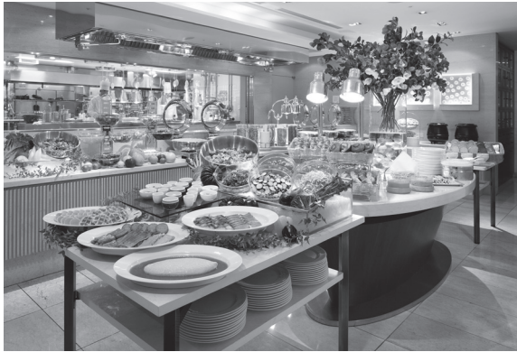
सुबह का नाश्ता (बुफ़े)

होटल और जापानी सरायों में तरह-तरह के नाश्ते मिलते हैं। कई जगह बुफ़े भी लगा होता है।