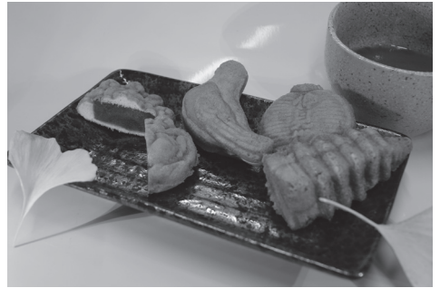
निन्यो-याकि यानी विभिन्न आकृतियों में बनी मिठाई