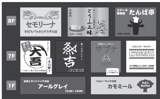
जापानी भाषा में लिखे सूचनापटल