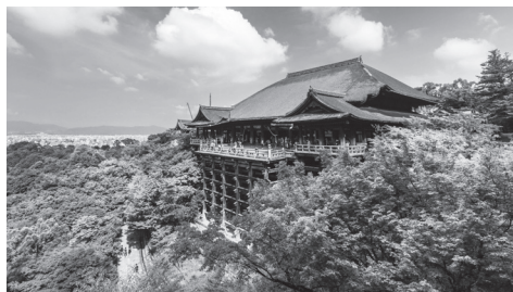
معبد کیو میزو درا (Kiyomizu-dera)

کیوتو مکان های دیدنی بسیاری دارد، مانند معابد تاریخی بودایی و شینتو، قلعه ها و باغ ها. مثلاً معبد "کیو میزو درا" که ایوان ساختمان اصلی آن به گونه ای ساخته شده است که از لبه یک پرتگاه بیرون زده است و یا معبد "ریو آنجی" (Ryoanji) که به باغ سنگی آن معروف است. معبد شینتوی "فوشیمی ایناری تایشا" که دروازه های ورودی آن به شکل تونلی امتداد دارند و قلعه "نیجو جو" که تزیینات داخلی زیبایی دارد نیز از مکان های دیدنی دیگر کیوتو هستند.