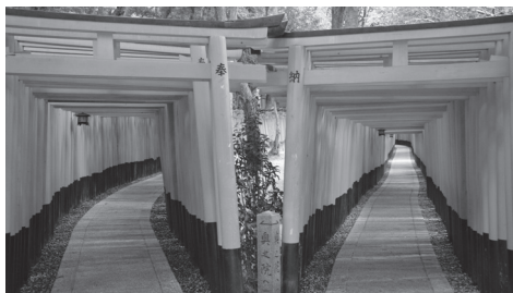
معبد شینتوی فوشیمی ایناری تایشا