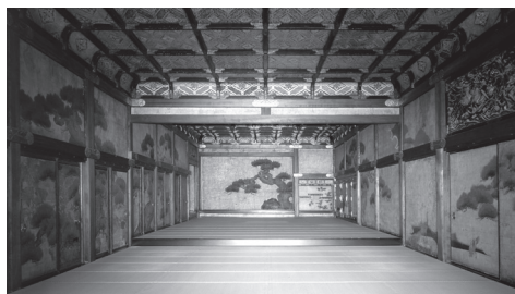
قلعه نیجو جو (Nijo-jo)