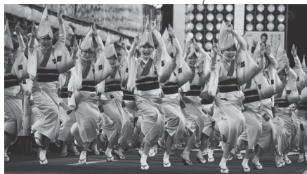
جشن اوا اودوری (توکوشیما/ ماه اوت)