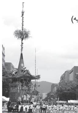
جشن گیون (کیوتو/ ماه ژوئیه)

در مناطق مختلف ژاپن هر ساله جشن های سنتی گوناگونی برگزار می شود. گفته می شود که تعداد جشن های ژاپن به چند صد هزار می رسد. برای مثال، جشن "گیون" در کیوتو حدود هزار سال قدمت دارد. در این جشن مردم نیایشگاه هایی را که با تزیینات باشکوه روی ارابه قرار گرفته اند، در خیابان های شهر به حرکت در می آورند. جشن "نیوتا" در آنوموری و جشن رقص "اوا اودوری" در توکوشیما نیز معروف هستند.