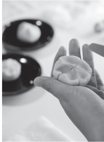
پختن شیرینی ژاپنی