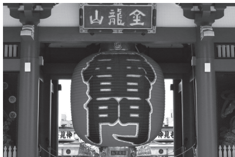
دروازه کامیناری مون

آساکوسا یک منطقه گردشگری محبوب در توکیو است. دروازه "کامیناری مون" (Kaminarimon) که فانوس قرمز رنگ بزرگ آن جلب توجه می‌کند، ورودی معبد "سنسوجی" (Sensoji) است و خیابان "ناکامیسه" (Nakamise) از آنجا آغاز می‌شود.