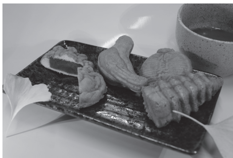
نوعی شیرینی ژاپنی به شکل عروسک (Ningyo-yaki)