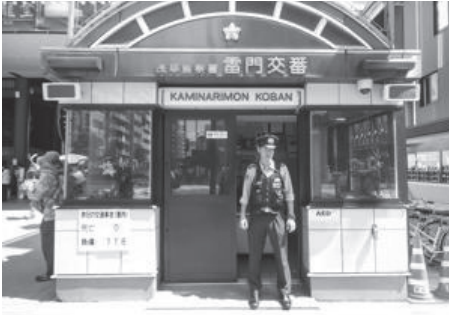
Metropolitan Police Department website