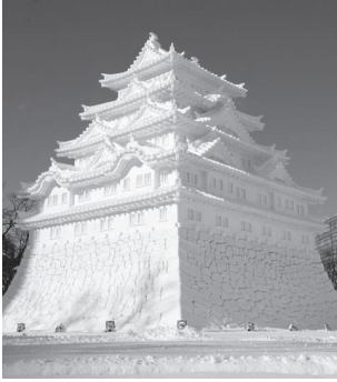
সাপ্পোরো তুষার উৎসব

উত্তর জাপানের হোঙ্কাইদো জেলা এর মনোরম, সুবিশাল নৈসর্গিক পারিপার্শ্বিক সৌন্দর্যের জন্য অসংখ্য পর্যটককে আকৃষ্ট করে। ইউনেস্কোর বিশ্ব প্রাকৃতিক ঐতিহ্য হিসেবে স্বীকৃত শিরেতোকো অঞ্চলে মুক্তভাবে ঘুরে বেড়ায় অগণিত বন্য প্রাণি। শীতকালে হোঙ্কাইদোতে তুষার উৎসব এবং স্কি সহ অন্যান্য শীতকালীন খেলাধুলা উপভোগ করা যায়। আসাহিকাওয়া শহরের আসাহিইয়ামা চিড়িয়াখানায় পেঙ্গুইনের দলকে তুষারের উপর সারিবদ্ধ হয়ে হাঁটতে দেখা যায়।