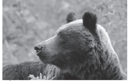
শিরেতোকো'র বন্য বাদামি ভালুক