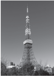
টোকিও টাওয়ার (333 মিটার)

উজ্জ্বল কমলা আর সাদা রঙের সংমিশ্রণে সুবিশাল টোকিও টাওয়ার হচ্ছে আরেক বিখ্যাত স্থাপত্য। আসাকুসা এলাকার কাছে অবস্থিত টোকিও স্কাইট্রি 2012 সালে নির্মাণের পর থেকে বিশ্বের সবচেয়ে উঁচু টাওয়ার। উভয় টাওয়ার রাতের বেলা মনোরম আলোকসজ্জায় সজ্জিত হয়, যা দূর থেকে দেখলেও চোখ জুড়ায়।