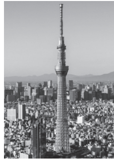
টোকিও স্কাইট্রি (634 মিটার)