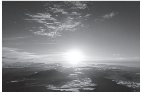
Mt. Fuji Climbing Official website