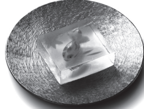
حلوى يابانية تباع في الصيف فقط