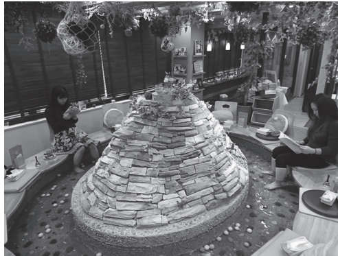
مقهى حمام الأقدام

هناك مقاهٍ أخرى مثيرة للاهتمام مثل مقاهي الوصيفات ومقاهي القبة السماوية ومقاهي حمامات الأقدام.