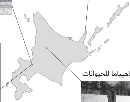
طيور البطريق في حديقة أساهيياما للحيوانات