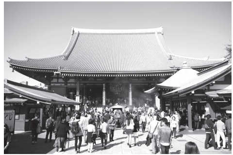
القاعة الرئيسية لمعبد سينسوجي البوذي