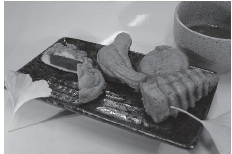
كعك نينغيو - يايكي على شكل دمي