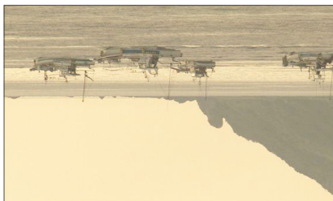
～熊本県 天草市通詞島～